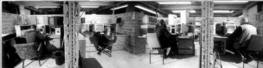
Audio - Video - Live - Production

Medienlabore · Archiv · Internet medialabs · archive · internet